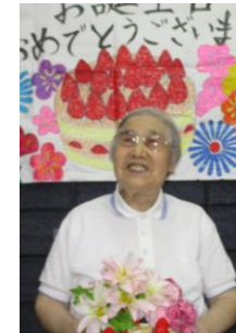
バースデーケーキを持って撮影