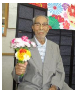
正装で記念撮影しました