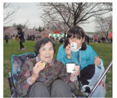
舎人公園は広々して、天候にも恵まれのどかでした